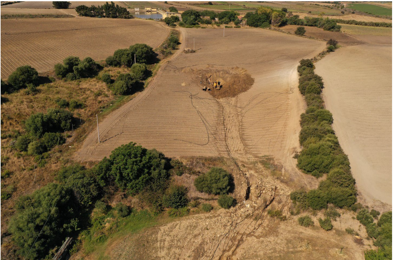
Foto 3 - Vista aerea da valle del sito dopo la rottura del 02.07.2023