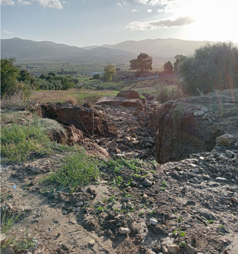
Foto 4 - Particolare delle aree dopo la rottura del 24.09.2023