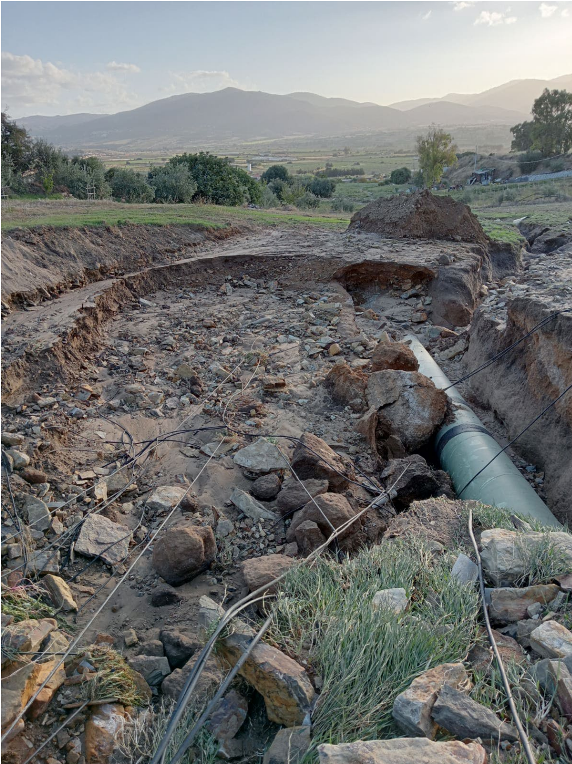
Foto 5 - Particolare delle aree dopo la rottura del 24.09.2023