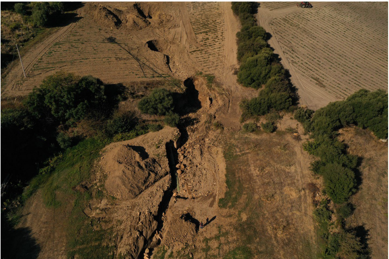
Foto 2 - Vista aerea da valle del sito dopo la rottura del 24.09.2023